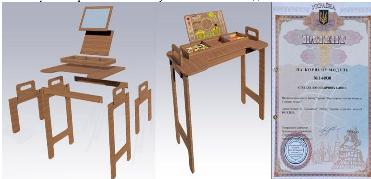
Рис. 1. Корисна модель «Стіл для логопедичних занять»

Комплект похилих дошок є двостороннім (наприклад, з одного боку дерев'яна основа для читання книг, а з іншого – магнітна дошка), тому логопеду не потрібно мати велику кількість змінних деталей.